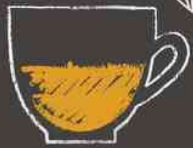
اسپرونگ فانتاز 28