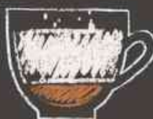
لاته (+ اسپروپ)